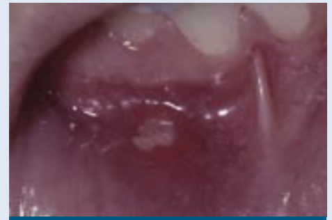
Úlcera de la boca