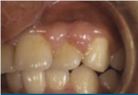
Crecimiento excesivo de las encías