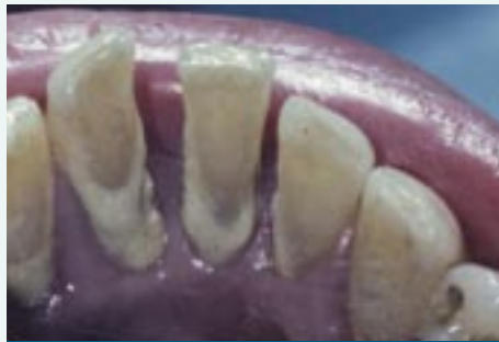
Depósitos de placa en los dientes