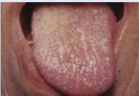
Afta ( candidiasis )

El fumar, la boca seca, la diabetes, y el tener dentaduras aumentan el riesgo de desarrollar aftas en su boca.